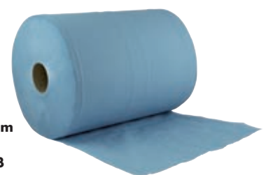
Papel doble premium para limpieza Cód. 90899 800 773