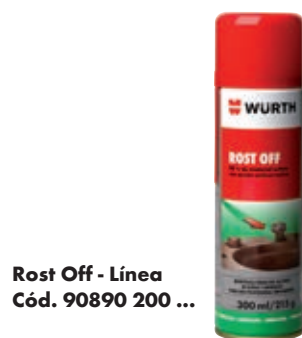
Rost Off - Línea Cód. 90890 200 ...