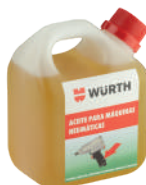
Aceite para máquina neumática. Cód. 00890 000