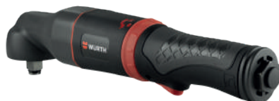
Atornilladora de impacto angular 1/2" Cód. 95714 300 0