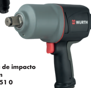
Atornilladora de impacto 3/4" Premium Cód. 95714 351 0