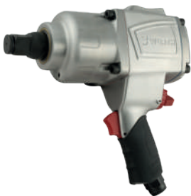
Atornilladora de impacto 1" corta Cód. 90703 776 0