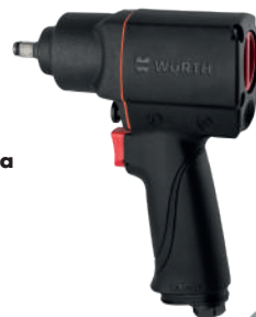
Atornilladora de impacto 3/8" plus Cód. 90703 301 0