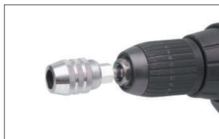
Taladro con encastre 1/4"