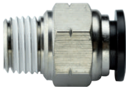
Unión recta con rosca macho