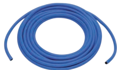
Manguera para aire comprimido 9mm Cód. 90699 929...