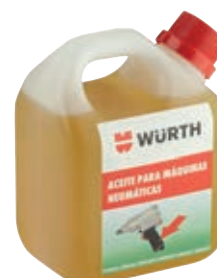
Aceite para máquina neumática Cód. 00890 000