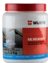
Gel decapante 1200 g. Cód. 80893 982