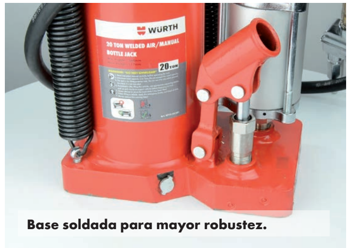
Base soldada para mayor robustez.