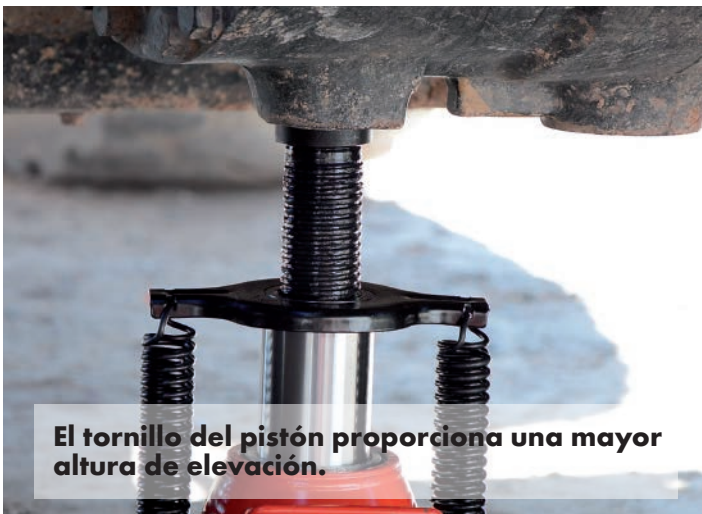
El tornillo del pistón proporciona una mayor altura de elevación.