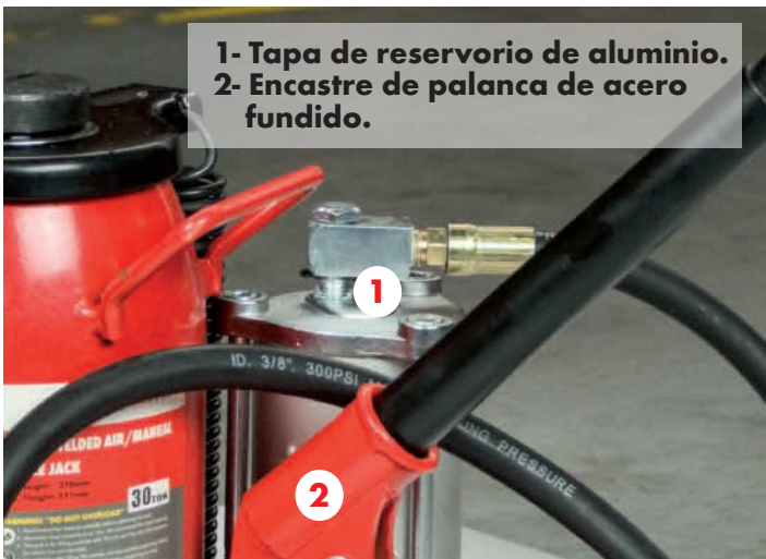
1- Tapa de reservorio de aluminio. 2- Encastre de palanca de acero fundido.