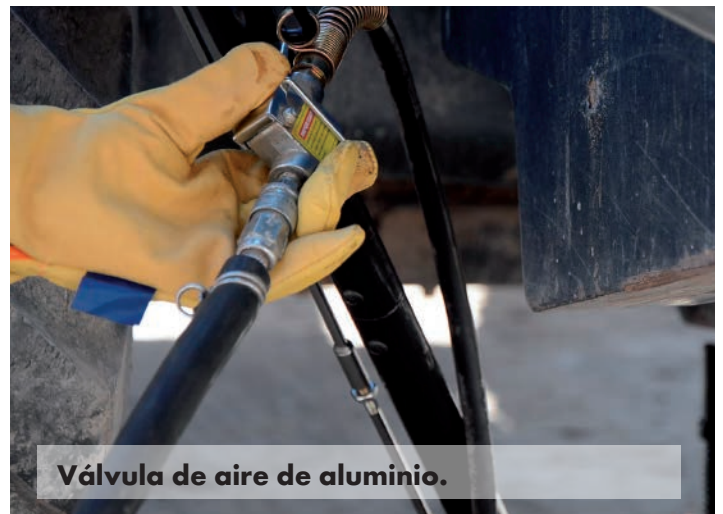
Válvula de aire de aluminio.