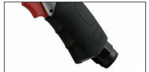
Mango soft-grip ergonómico y entrada de aire de 1/2" con rotación libre de 360°.