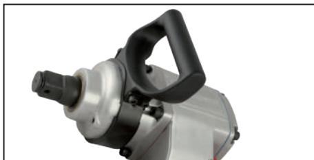
Mango adicional ajustable 360° para mayor comodidad de uso.

Cuando se utiliza la atornilladora diariamente se deberá recargar el filtro lubricador (Cód. 90699 101 12) con aceite para línea neumática. En caso de usarla esporádicamente, verificar el nivel de aceite.