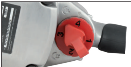
Conmutador para seleccionar el sentido de giro. Perilla para seleccionar 4 niveles de torque.