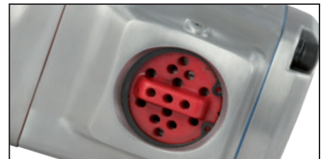
Salida de aire superior que permite direccionar el aire en 360° para evitar molestias en el uso.