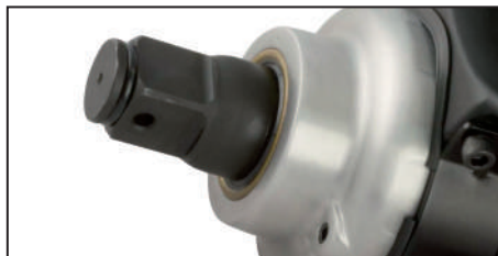
Encastre de 1" con agujero pasante para asegurar el tubo de impacto.