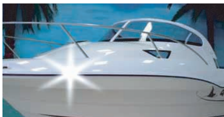
Plástico reforzado con fibra de vidrio.