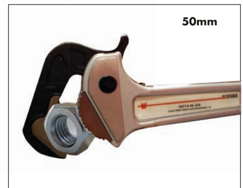
Material hexagonal de 17-50mm.