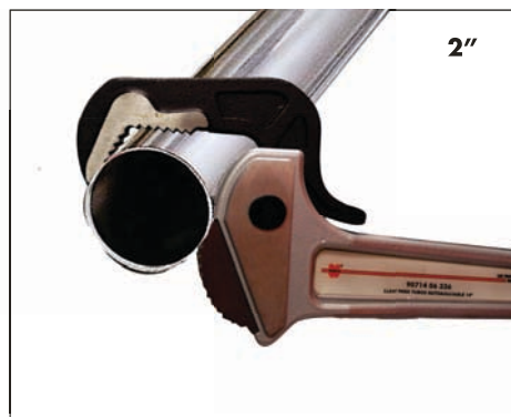
Material redondo de 1/2" - 2"